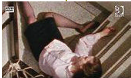
Pas de retour à la case départ